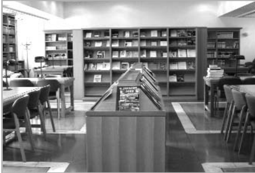
Αποψη του αναγνωστηρίου της βιβλιοθήκης του Τμήματος Οικονομικών Επιστημών