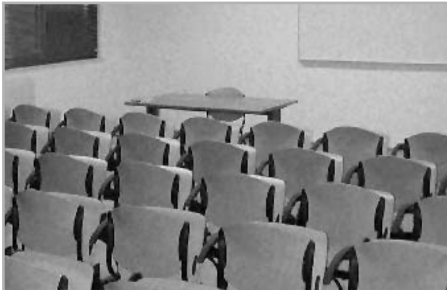
Αίθουσα σεμιναρίων στο κτίριο Ευριπίδου 14 (3ος ορ.)