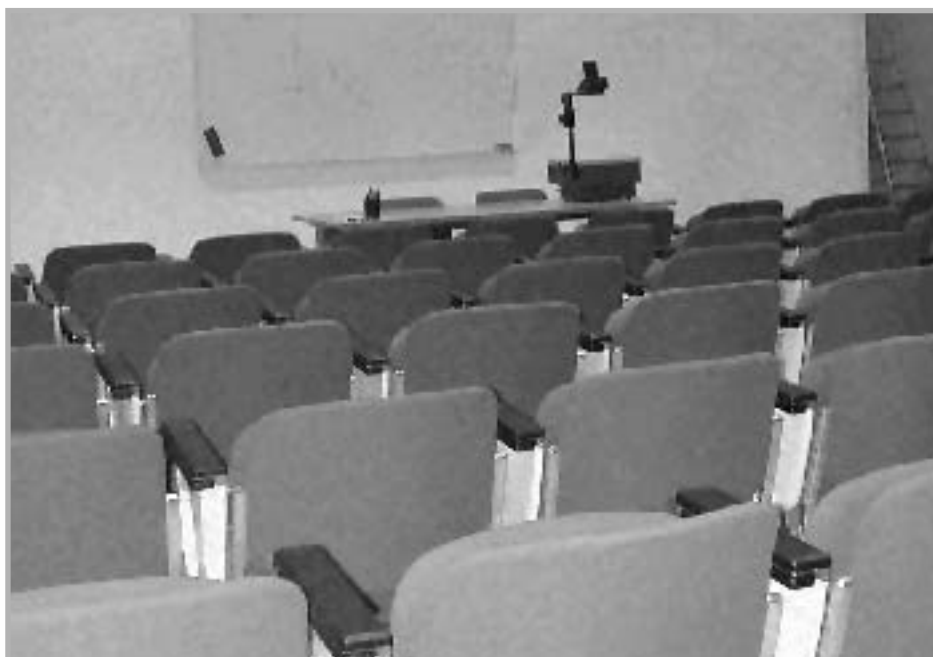
Αίθουσα σεμιναρίων στο κτίριο Ευριπίδου 14 (6ος ορ.)