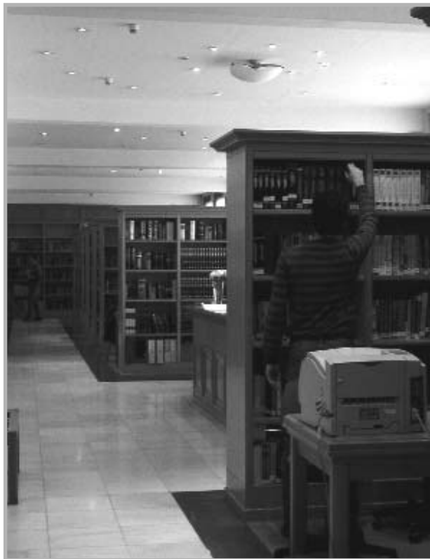
Αποψη της βιβλιοθήκης του Τμήματος Οικονομικών Επιστημών